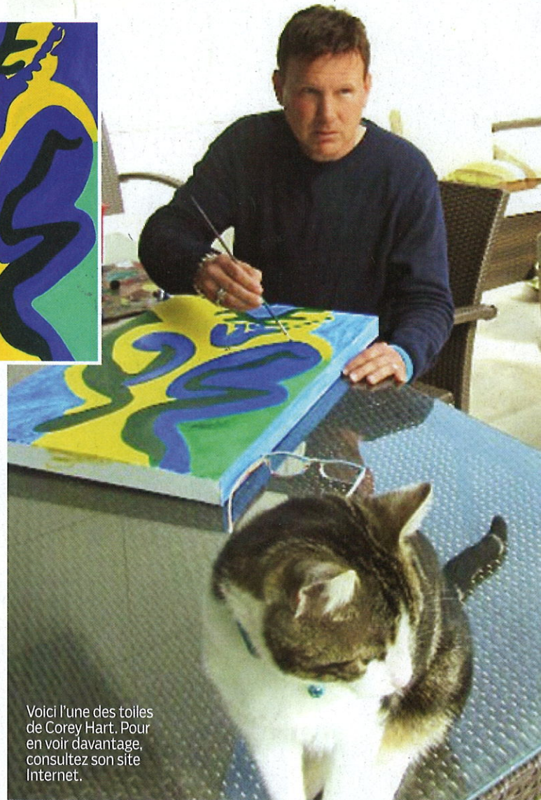
Voici l'une des toiles de Corey Hart. Pour en voir davantage, consultez son site Internet.