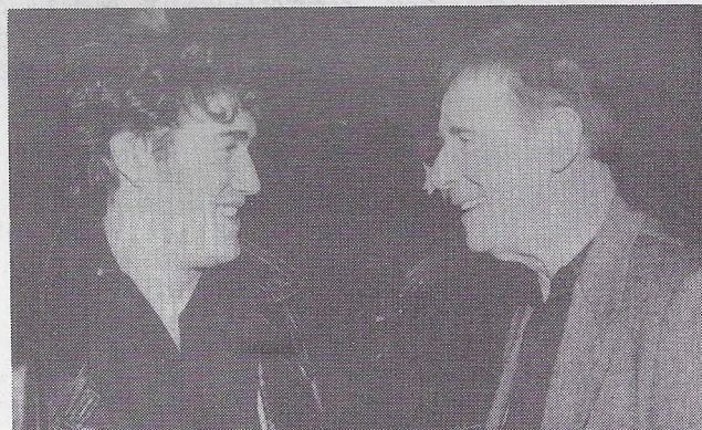
Et quelques pas plus loin, Roy Dupuis! Attention! Ne va pas croire des choses!!!