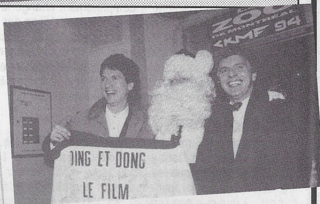
Comme c'était quelques jours seulement avant Noël, le Père Noël a remis à Ding et Dong un chandail que tous les membres de l'équipe qui a participé au film avaient signé.