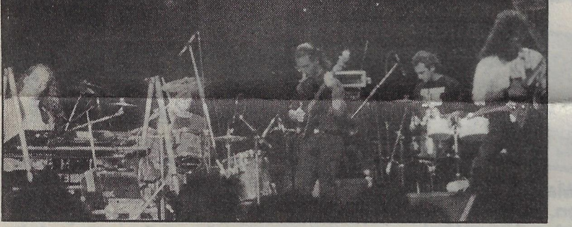
POUR UN GROUPE MUSICAL DÉTONNANT APPELÉ C-225 DU NOM DU LOCAL OÙ ILS PRATIQUAIENT AU CÉGEP DU VIEUX-MONTRÉAL, UN ANIMATEUR-PRÉSENTATEUR CHEVRONNÉ, MARC-ANDRÉ COALLIER.