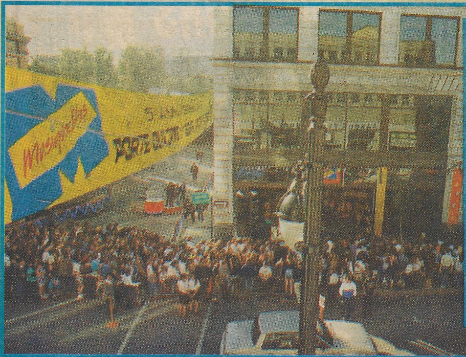
ENVIRON 5 000 PERSONNES ONT RÉPONDU À L'INVITATION "Portes ouvertes" de MusiquePlus.