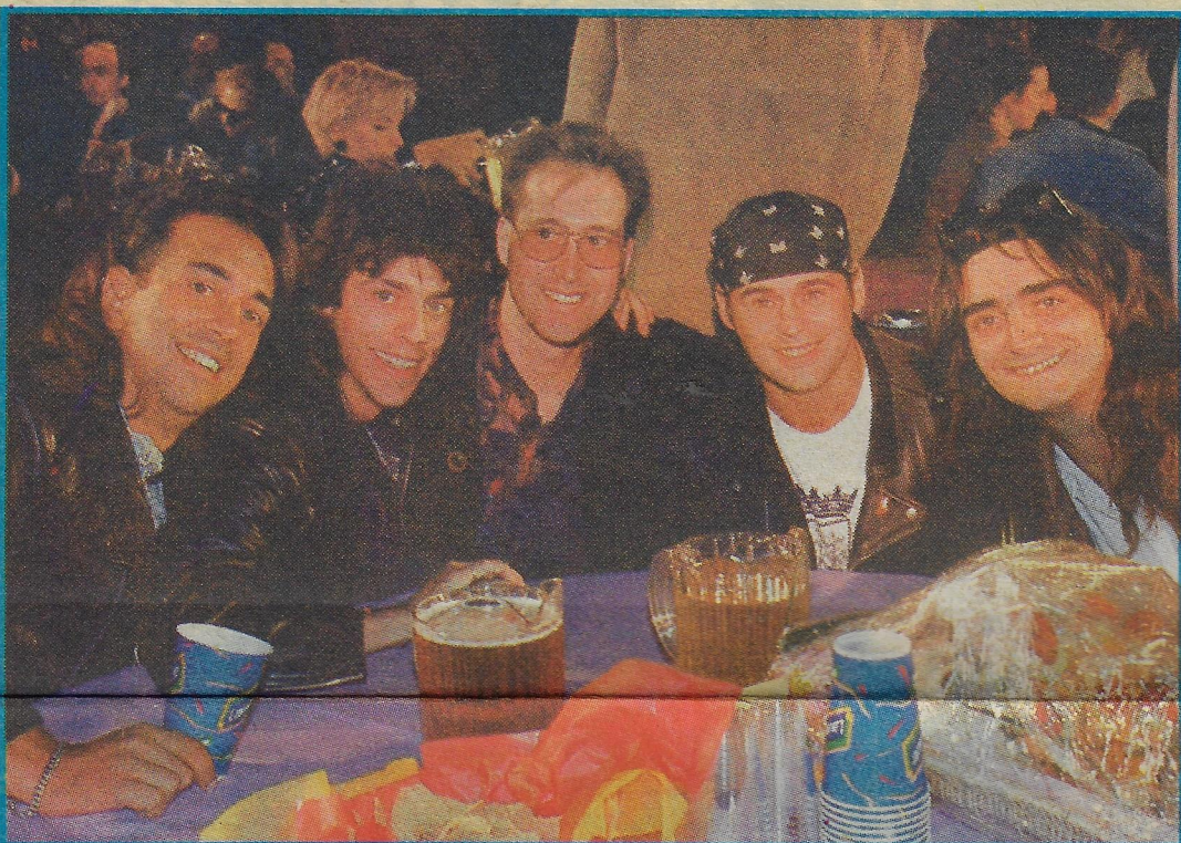
VILAIN PINGOUIN A REMPORTÉ TROIS TROPHÉES à ce premier vidéogala.

Les quelque cinquante personnes du public qui s'étaient procuré des laissez-passer pour y assister ne semblaient pas incommodées par cette descente du mercure. Entassés sur une portion de rue, ces jeunes à l'enthousiasme déchaîné ont su réchauffer l'at-