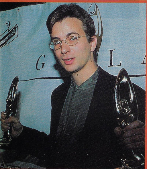
Luc de Larochellière, interprète de l'année