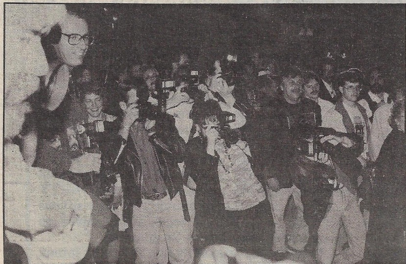
LES PHOTOGRAPHES JOUAIENT DU COUDE POUR SAISIR LA BELLE JULIE.