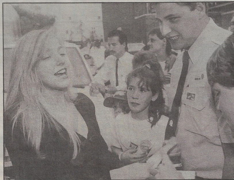
COMME TOUJOURS JULIE MASSE a sympathisé avec ses fans. La jeune chanteuse était en grande forme.