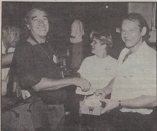
LE PHOTOGRAPHE GUY CHAPUT donne généreusement à la collecte spontanée d'un employé de Radio-Québec dans les coulisses du théâtre Denise-Pelletier.