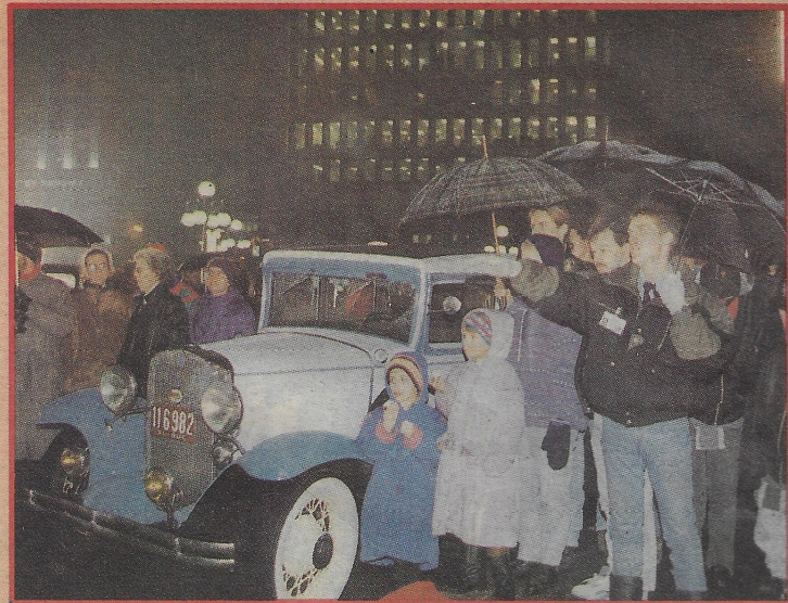
AU MILIEU DE PLUSIEURS BELLES D'OUTREFOIS, des centaines de curieux ont patienté durant des heures sous la pluie pour voir entrer les vedettes de la soirée.