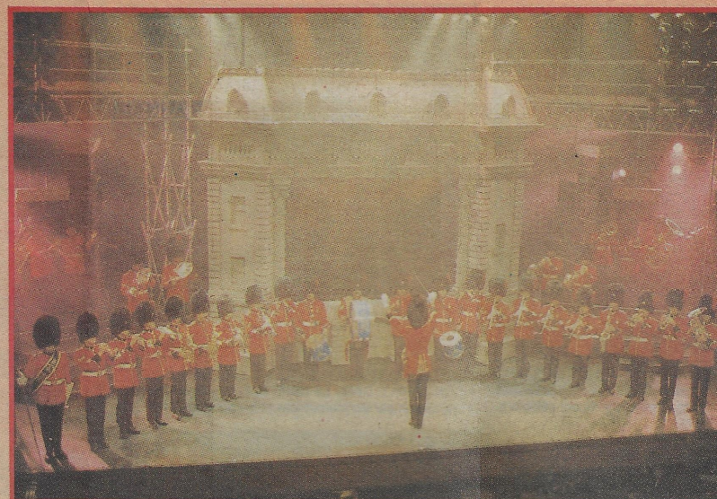
LA FANFARE DU ROYAL 22 e RÉGIMENT, qui avait ouvert le show, est revenue interpréter quelques marches militaires.