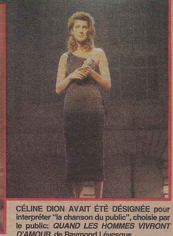
CÉLINE DION AVAIT ÉTÉ DÉSIGNÉE pour interpréter "la chanson du public", choisie par le public: QUAND LES HOMMES VIVRONT D'AMOUR, de Raymond Lévesque.