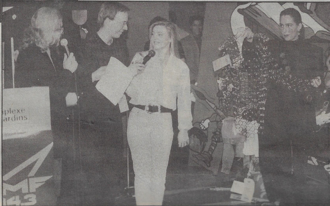
LA PERSONNE QUI S'EST PROCURÉ cette tenue de scène de Julie Masse a fait une bien bonne affaire.