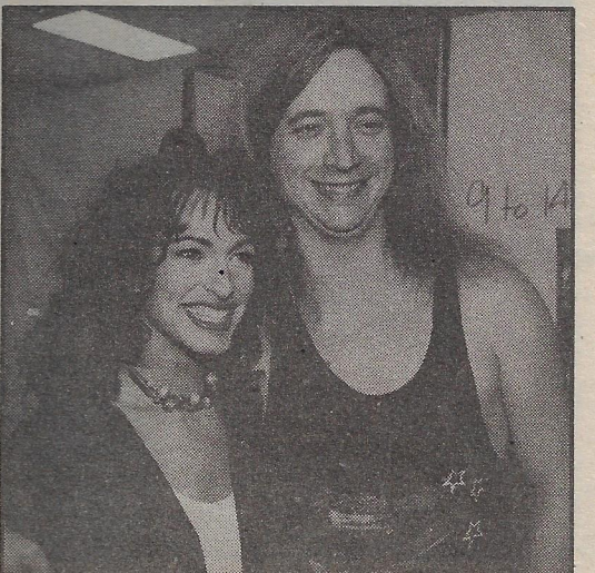
DAN BIGRAS A FAIT CROULER la salle avec sa brillante interprétation de son mégatube, TUE-MOI.