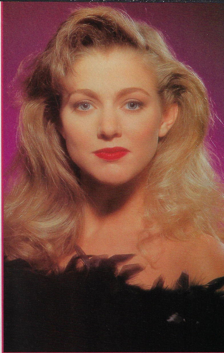
Élegante, la jeune chanteuse se pare de plumes.

d'une université, à poursuivre mes études en biologie ou en psychologie, deux domaines qui me passionnaient. Pour en revenir à votre question, je me serais tout de même engagée à fond, mais dans un but différent. En bon Gémeaux que je suis, je ne suis pas le genre de personne à entretenir des idées négatives! (rires)