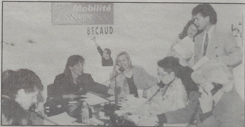
LA PRÉSENCE DE JULIE MASSE a stimulé les bénévoles qui logeaient des appels auprès de 2,000 personnalités de différents milieux.

journee et demandé à Julie Masse de venir à Québec appuyer le travail de ses téléphonistes bénévoles. Les dirigeants de H.D.S. souhaitent que l'intervention directe de la chanteuse aurait un effet de persuasion auprès des personnes rejointes. Les résultats n'ont pas