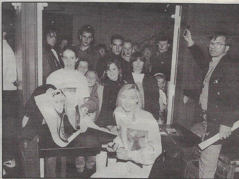
ELLE ADORE SIGNER DES AUTOGRAPHES, "les gens sont tellement gentils avec moi" dira-t-elle.