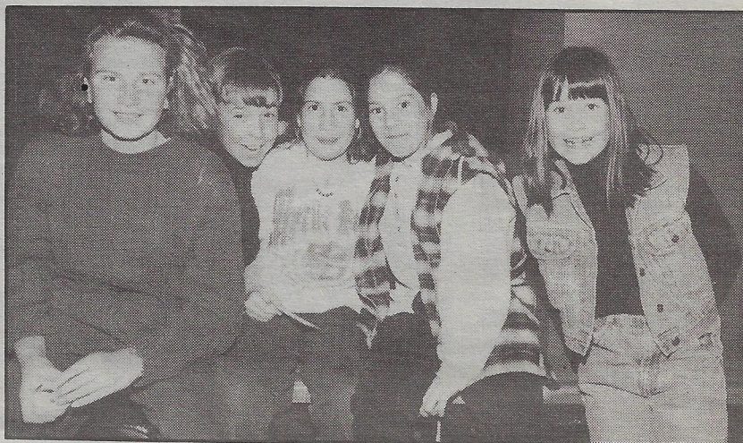
LORS DU SPECTACLE d'après-midi, beaucoup de jeunes assistaient au spectacle.