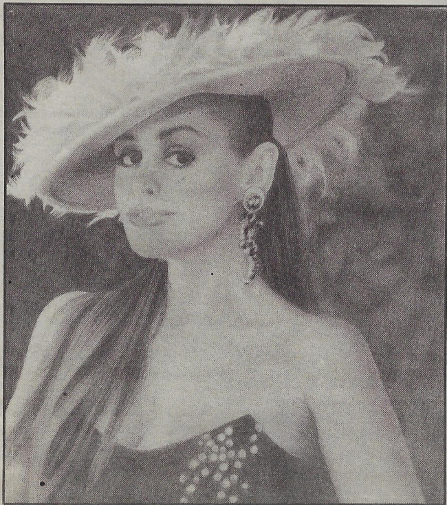
Louise Portal, par Nicole Croteau, crayon de mine.