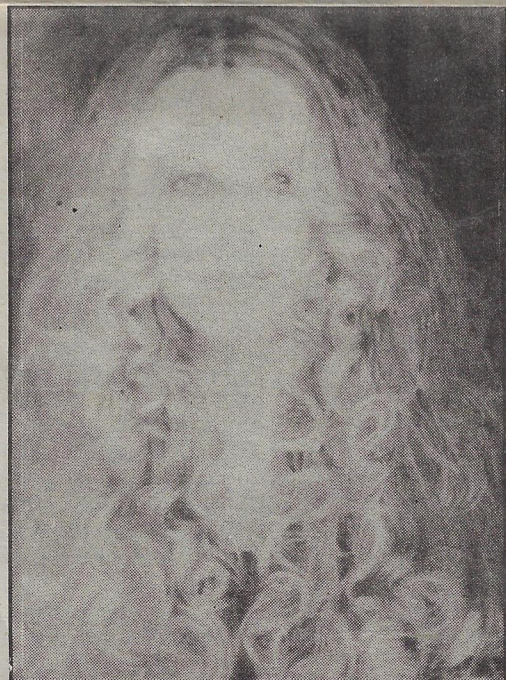
Brigitte Bardot, par Huguette Fontaine, crayon de mine.