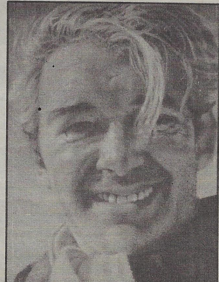
Félix Leclerc, par Louise Julien, crayon de mine.

(sortie Industriel nord) autoroute 40, de Montréal, de la Rive-Sud: autoroute 40 Est, de Québec, de Trois-Rivières: autoroute 40 Ouest, de St-Jérôme, Tenonbonne: 640 Repentigny et 40 Est. C'EST GRATUIT!