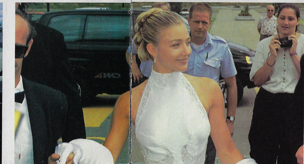
encadrée par ses gardes du corps