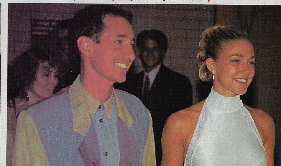
▼ Quelques instants à peine après l'échange des anneaux