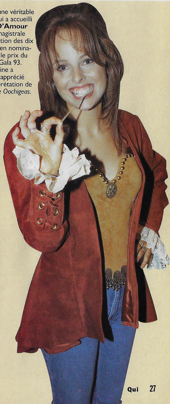
► C'est une véritable ovation qui a accueilli France D'Amour après sa magistrale interprétation des dix chansons en nomination pour le prix du public au Gala 93. Roch Voisine a sûrement apprécié son interprétation de La Légende Oochigeas .