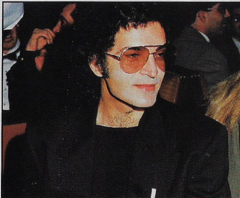
Le chanteur de renommée internationale Gino Vannelli fut au nombre des personnalités remarquées.