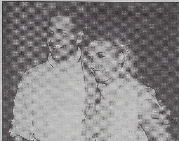
LA CHANTEUSE SOIGNE SES RELATIONS. Elle s'est fait photographier avec plusieurs disquaires de la région de Québec.