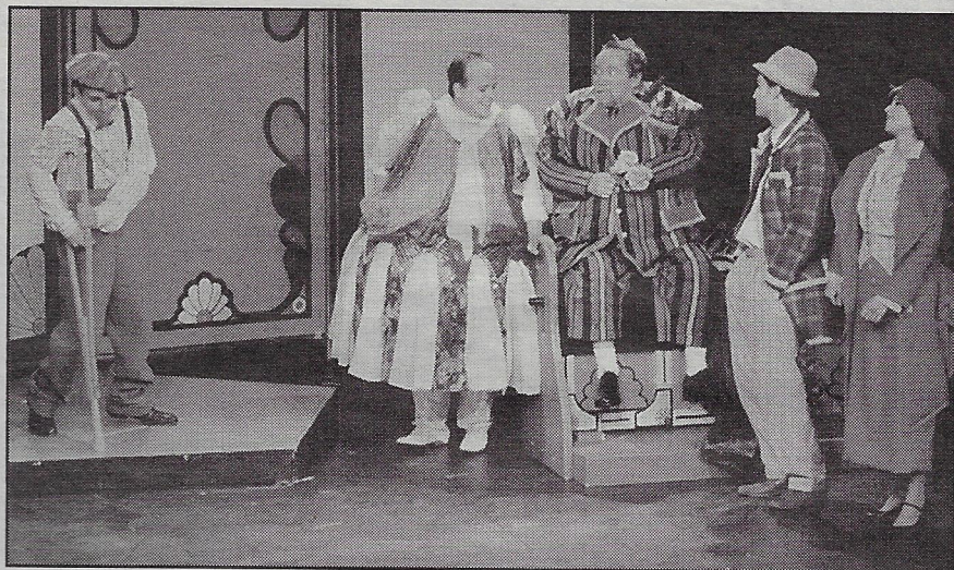
UNE SCÈNE DE TIZOUNE, MONTRÉAL ET LES AUTRES, dont le manuscrit vient d'être publié chez VLB.