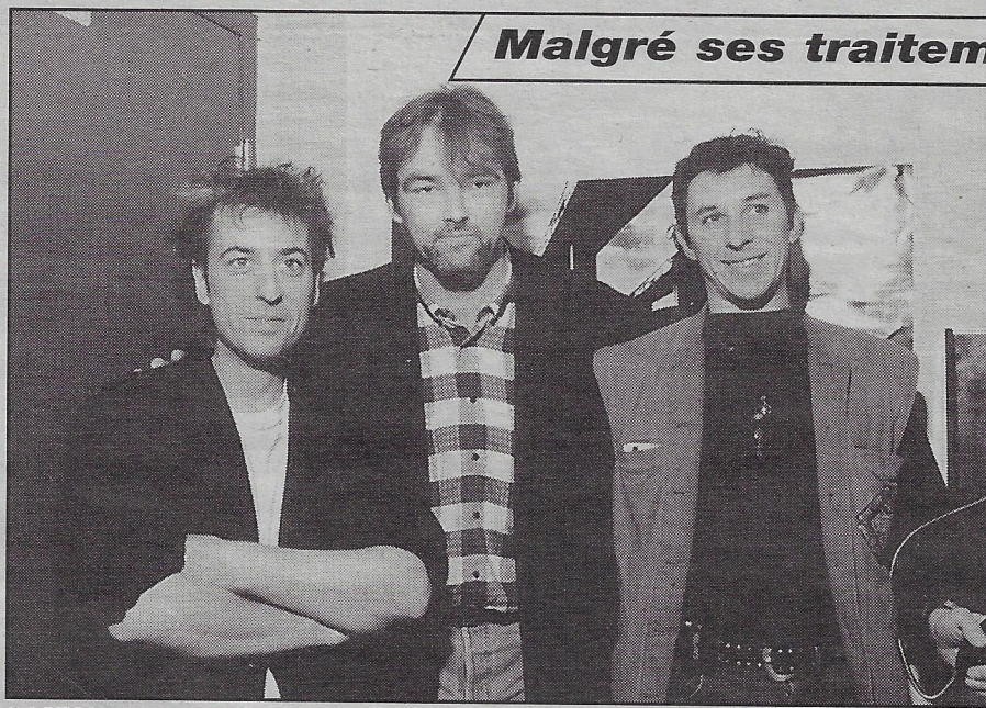
GASTON MANDEVILLE SE PRODUIRA AU SPECTRUM, en première partie du spectacle de son grand copain Gildor Roy.