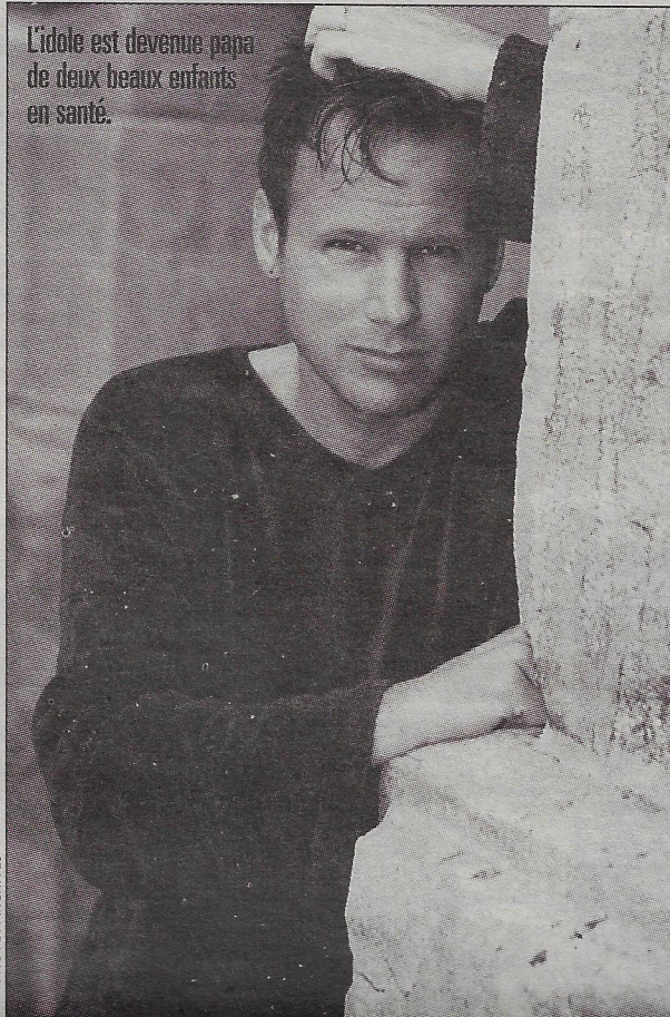
L'idole est devenue papa de deux beaux enfants en santé.