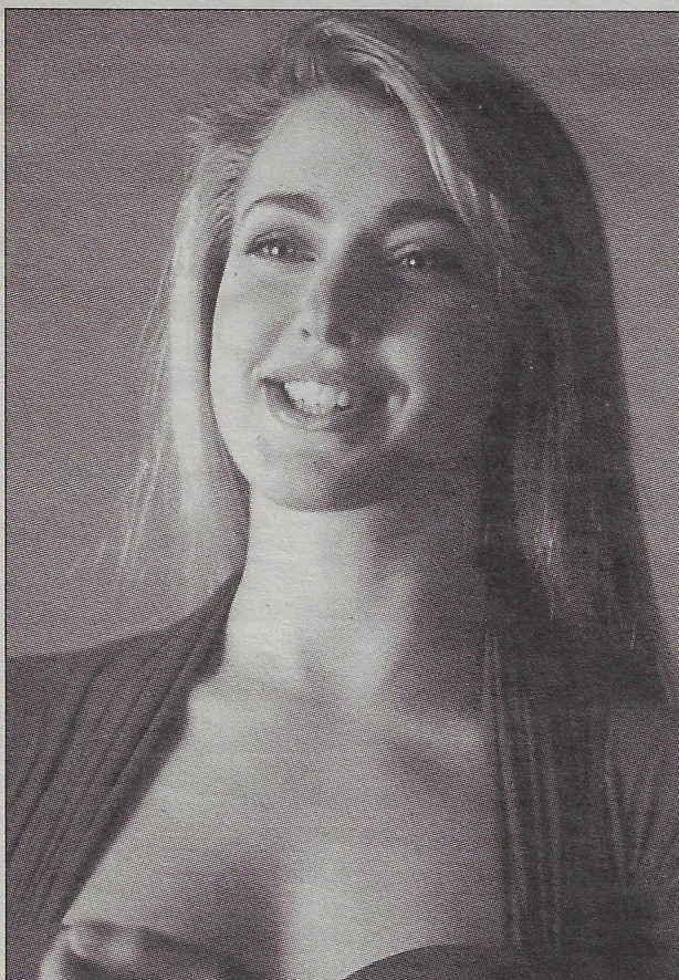
Julie Masse a redonné le bonheur au chanteur Corey Hart.