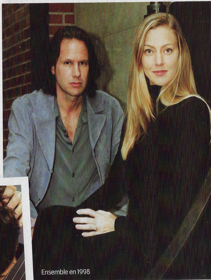
Ensemble en 1998

dernier, et je l'aime tellement! Il fait du taekwondo après l'école. Il aimerait mieux jouer au tennis comme ses sœurs, mais je pense que trois sportives, ça suffit!